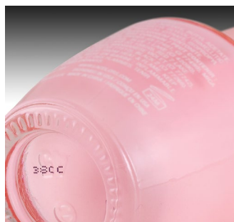
압출 성형 - 플라스틱