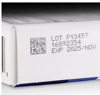
제약 - 종이 보드