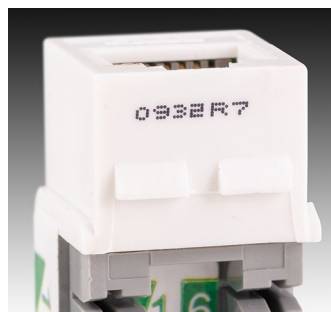
음료 - 플라스틱