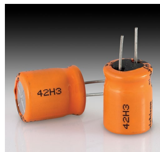
전자 부품 - 플라스틱